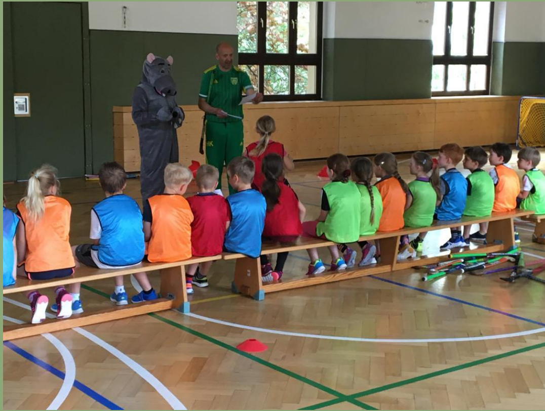
Schulhockey in Beucha