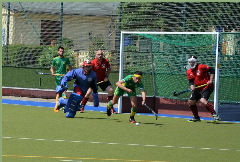
Punktspiel gegen den Leipziger SC